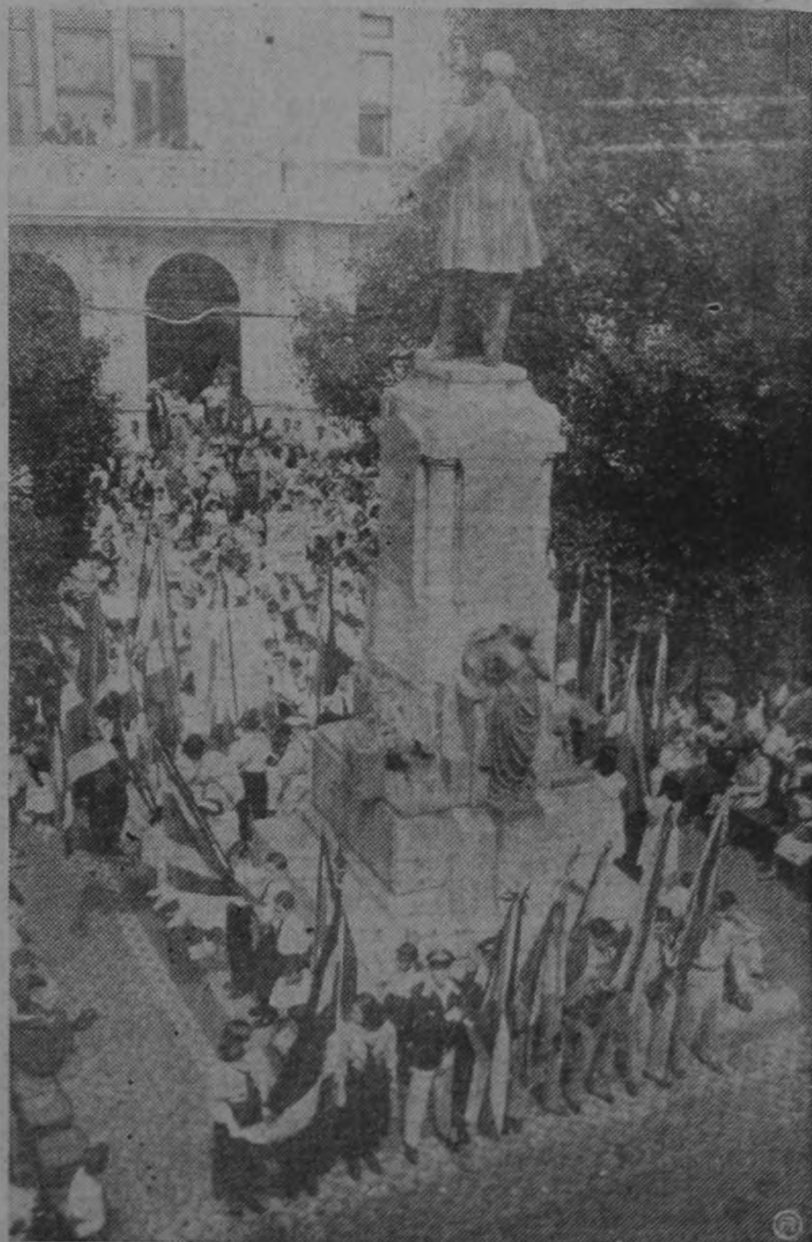
Conmemorando el 92º aniversario de la muerte del General y Benemérito de la Patria don Juan Rafael Mora, se realizó ayer una interesante y significativa actuación ante el monumento que perpetúa su memoria. Desfilaron delegaciones de Colegios y Escuelas y fueron colocadas ofrendas florales y pronunciados hermosos discursos recordatorios.