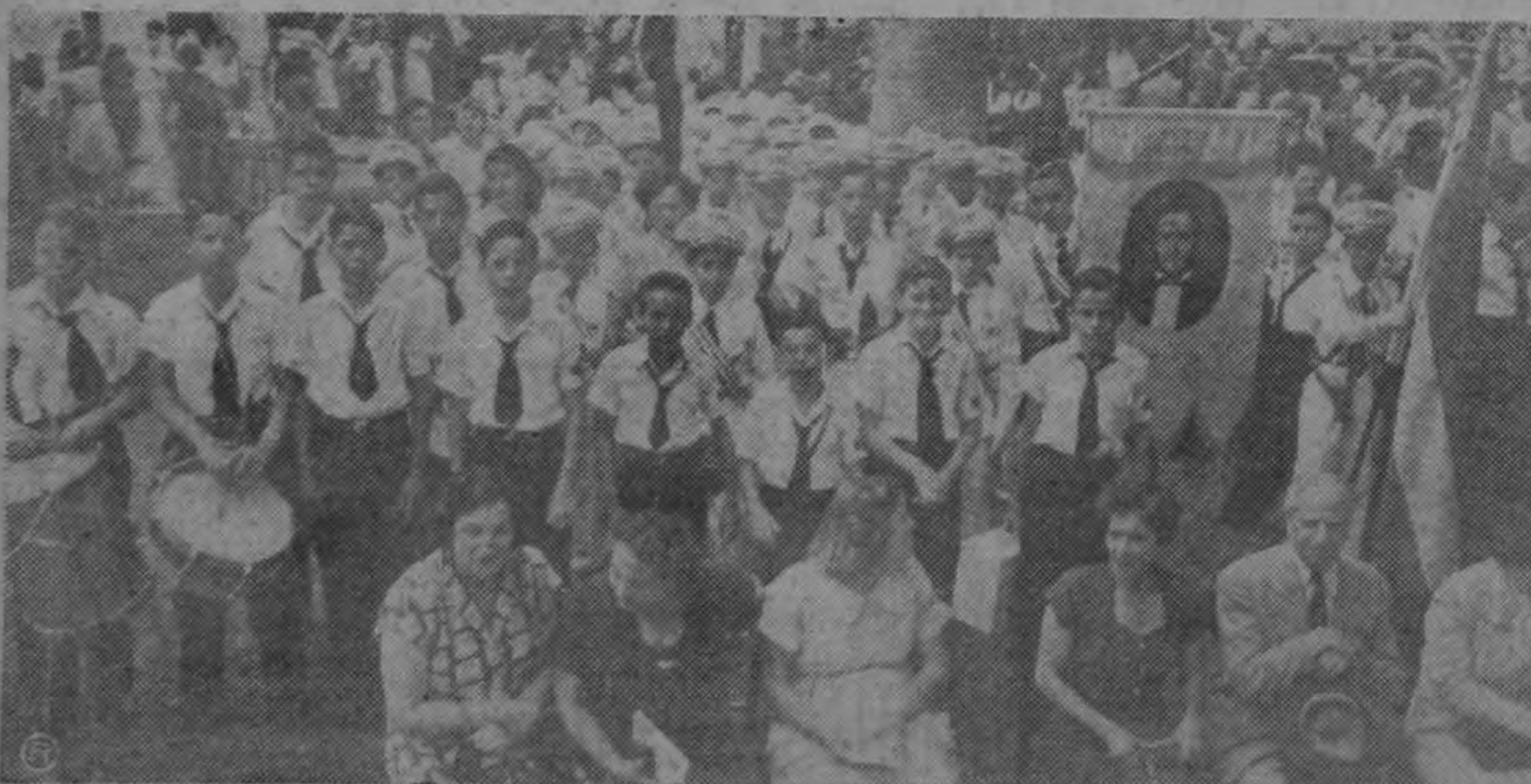
Alumnos de la Escuela "Juan Rafael Mora" forman ante el monumento al prócer, durante la actuación que se llevó a cabo ayer en su homenaje, conmemorando el 92º aniversario de su muerte.—(Foto Arévalo).