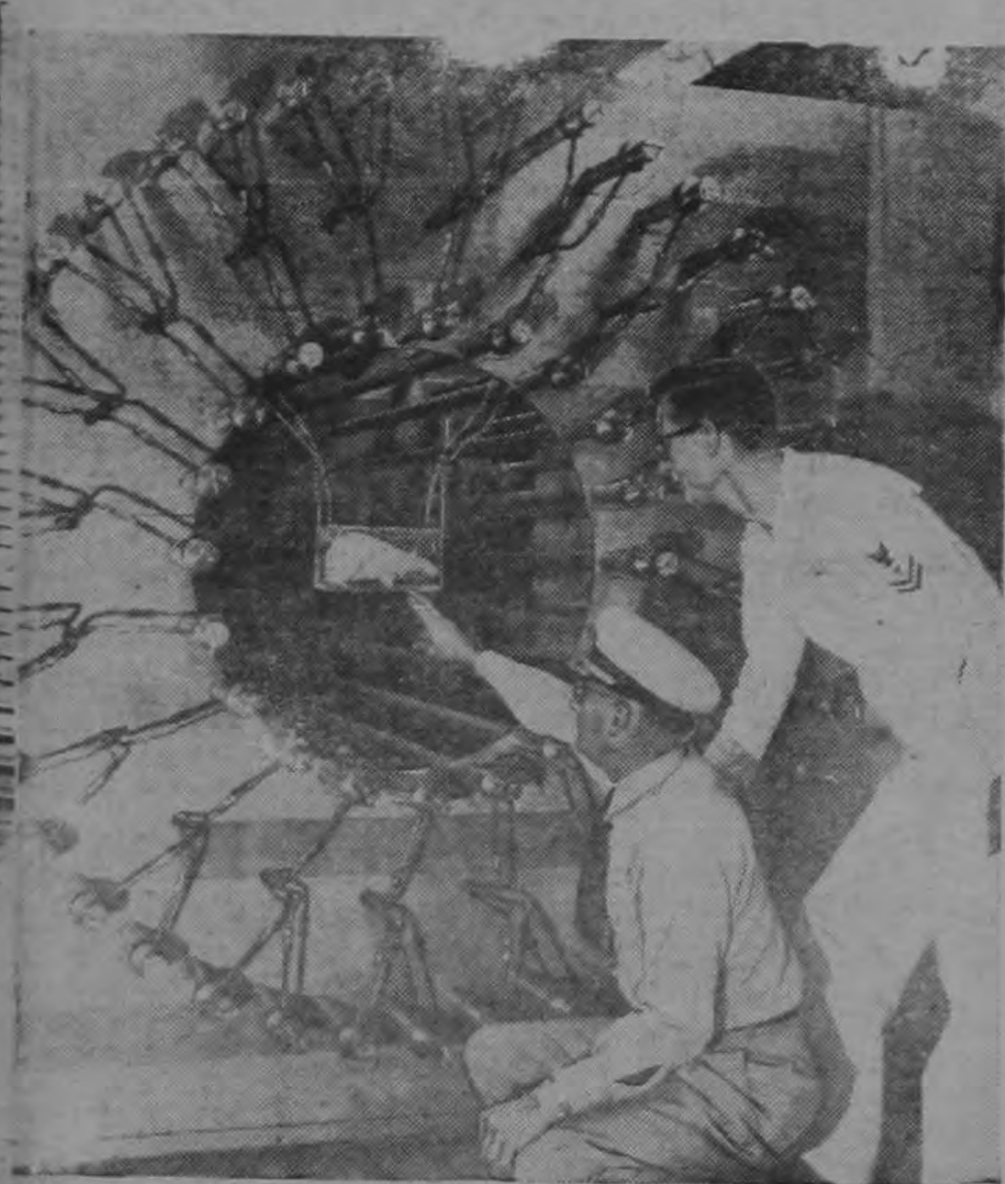
Este es el primer generador de rayos "gamma" que se ha construido con fines experimentales. Registra al detalle los efectos de la irradiación. Al centro se ha colocado un animal que recibe los rayos por todas partes, exactamente como si se encontrara en el foco de una explosión atómica.