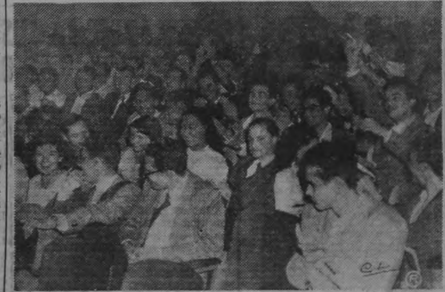
Estudiantes universitarios en la asamblea que se efectuó ayer en la mañana para resolver sobre la situación planteada con motivo de la decisión legislativa sobre construcciones. Fue ratificado el acuerdo del Consejo Estudiantil de ir a la huelga en señal de protesta.

La impresión más generalizada, y en ella reside la confianza de la opinión pública, es la de que esta tregua será de corta duración y pronto quedará restablecida la normalidad de la nación, gracias a la cordura de los poderes públicos y al respeto inquebrantable a las instituciones.