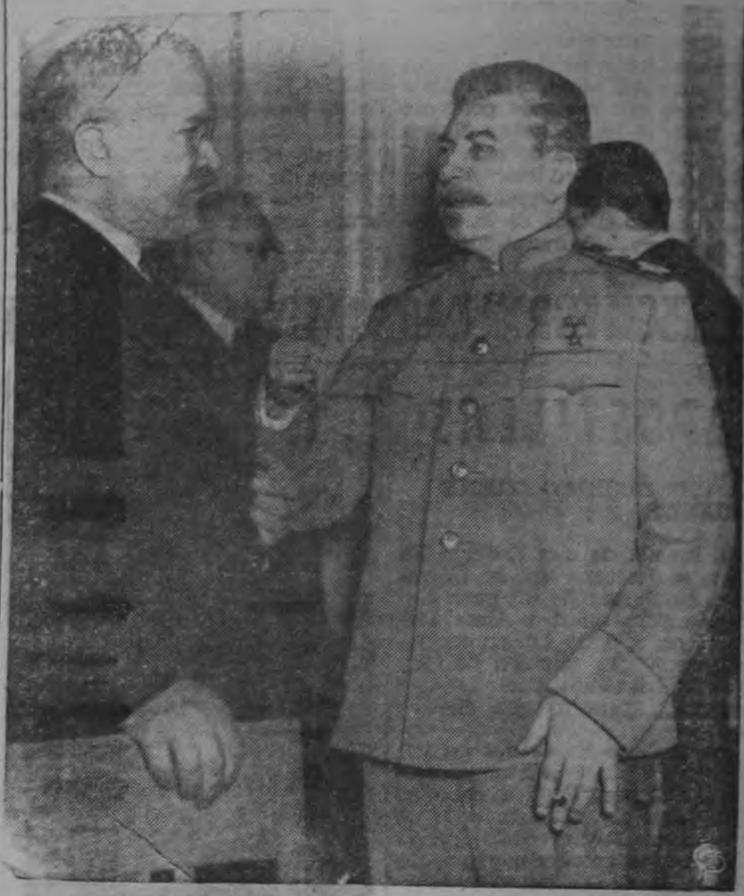
Stalin en Yalta! Viacheslav Molotov, entonces, Ministro de Relaciones, escucha atento a su Jefe. Al fondo se encuentra Andrei Vishinsky, nuevo Ministro del Exterior

"Es necesario organizar la ayuda política que presta la clase trabajadora de los países burgueses a la clase trabajadora de nuestro país con la mira de en-