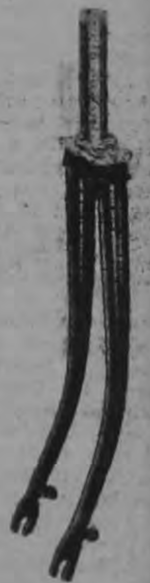
Con horquilla de doble tubo. Patente exclusiva HUMBERT.

Le invitamos a ver estos modelos y consultar nuestro plan de ventas