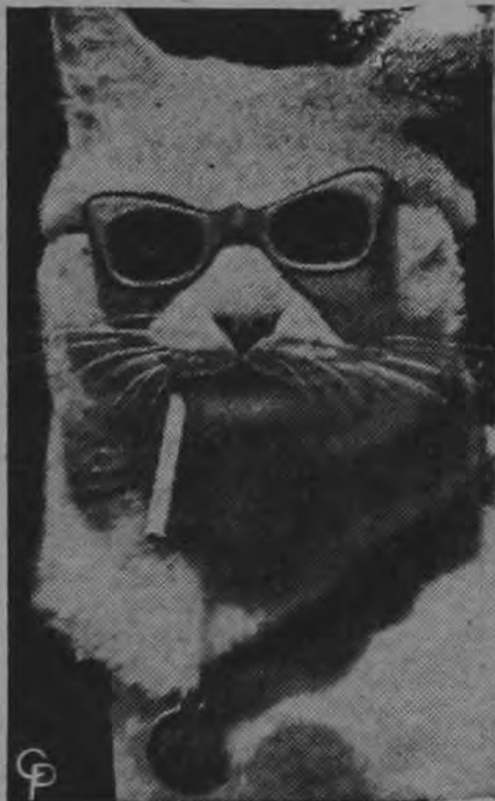
Este gato, fumando y con anteojos contra el sol, fué fotografiado en el reciente Festival Cinematográfico de Venecia, Italia. El minino fué arreglado por varios artistas de cine concurrentes al torneo.

WASHIUNGTON 29. (USIS) — La Asociación Nacional de Educación de los Estados Unidos informa que en este país un número mayor que nunca de amas de casa asiste a las clases para adultos en los colegios públicos. De