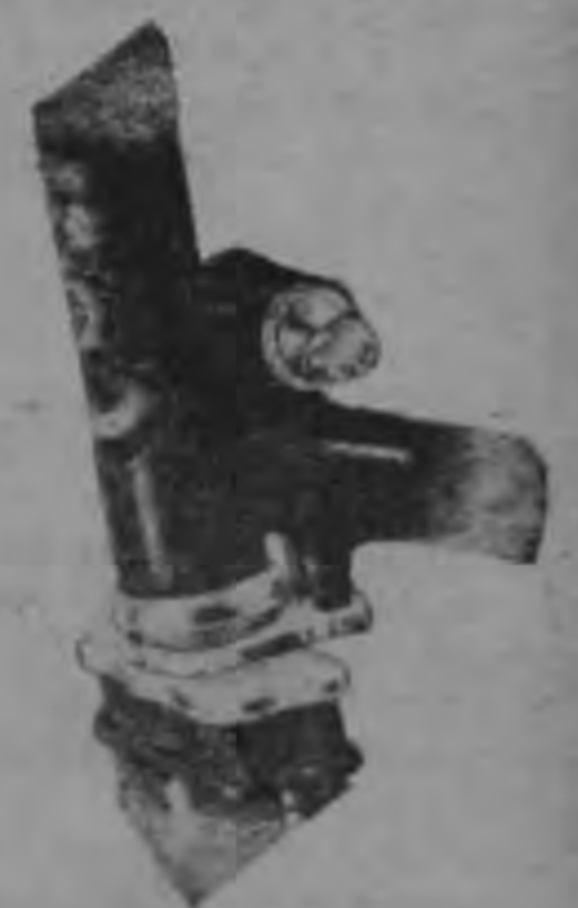
Con cerradura automática de llavin en la barra para evitar robos.