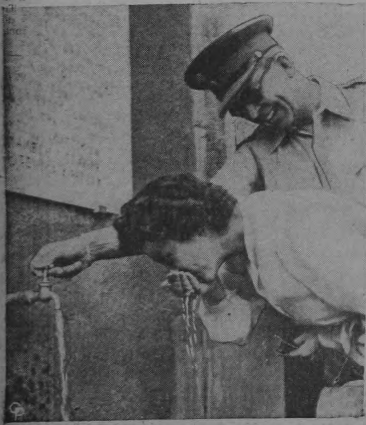
El Rey Pablo de Grecia abre la llave del agua para que su esposa, la Reina Federica, tome el primer sorbo en la inauguración de la cañería de Marvromati. A la realización de la obra contribuyeron amigos de Grecia en los Estados Unidos.

Fernando Lara B. El Lic. Tosi al manifestar que atenderá personalmente esa representación, pidió que se le permitiera hacer la sustitución posteriormente y previo el aviso correspondiente cuando el Consejo se encuentre organizado y se tengan preparados los trabajos o planes respectivos.